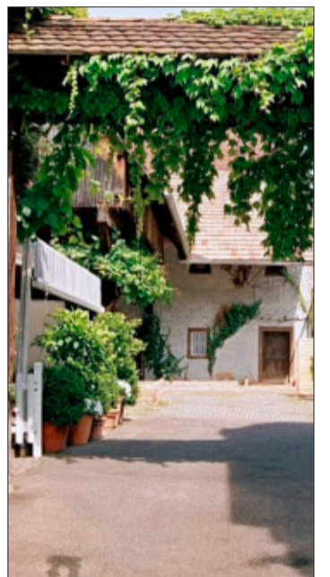
... oder denkmalgeschützter Winzerhof im Markgräflerland: Die unterschiedlichsten Kundenwünsche können bedient werden.